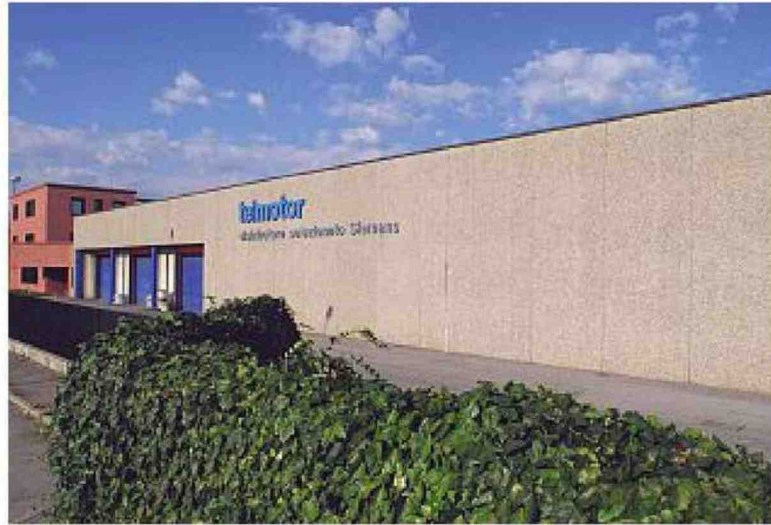
La sede di Bergamo Si trova in via Zanica, 91.